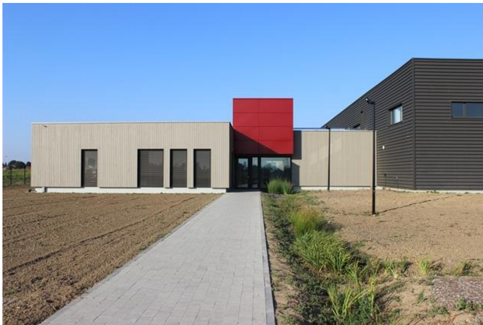
Le siège du groupe 3E Concept a été inauguré le 16 juin dernier.